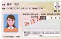
マイナンバー (個人番号)カード