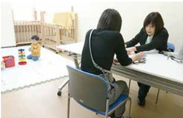
出張マザーズコーナー