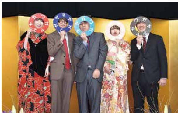
前回の成人式の様子

申し込みは、いずれも当日直接。 環境保全審議会 ▽日時 6月3日(月) 午前10時 ▽場所 クリーンセンター16階 多目的室 ☎ 環境総務課 (☎ 821・4 055) 枚方寝屋川消防組合 議会定例会 ▽日時 6月10日(月) 午前10時 ▽場所 枚方寝屋川消防組合消防本部5階会議場 ▽定員 12人 ☎ 枚方寝屋川消防組合総務管理課 (☎ 852・9903)