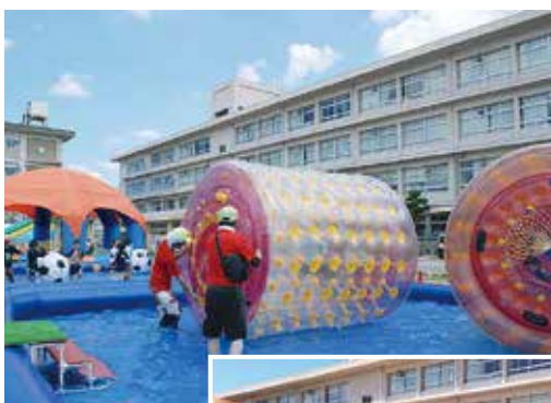
水の中を歩けるチューブ