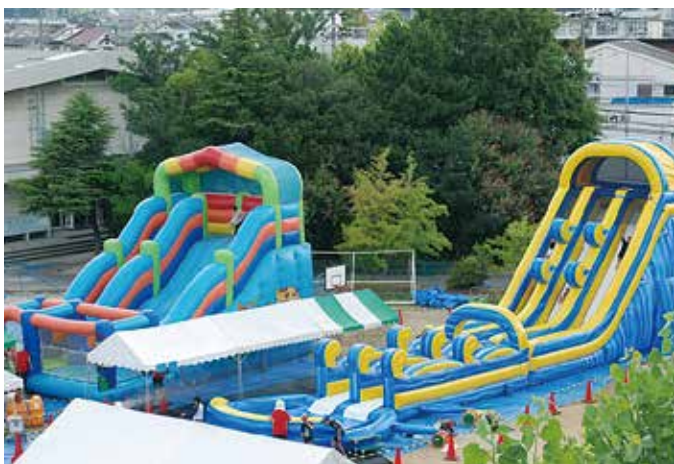
高さ7メートル、長さ20メートルの巨大スライダー

※①雨天・荒天中止、延期・振替などはありません②駐車場はありません③各日程2部制…<1部>午前9時～11時30分<2部>午後1時～3時30分