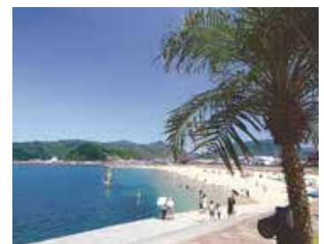
すさみ町のビーチ

☎ 市・すさみ町都市提携連絡協議会事務局 (市市民活動振興室内、☎825・2120)