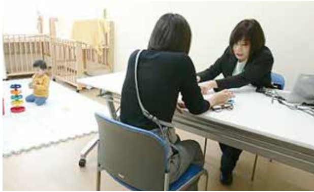
出張マザーズコーナー

▽融資期間 5年以内 ▽担保 原則不要 ▽連帯保証人 法人、組合のみ代表者 ※詳しくは、問い合わせてください。 ◎ 市立産業振興センター（☎828・0751） 経営支援アドバイザーの無料経営相談