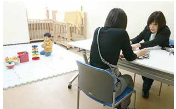
出張マザーズコーナー

程度)、リラック3階ミーティングルーム1、相談無料。 ※完全個室、子ども連れ可、キッズスペースあり。 申込・④ 開催日の前々日までに電話で市立産業振興センター (☎828・0751)