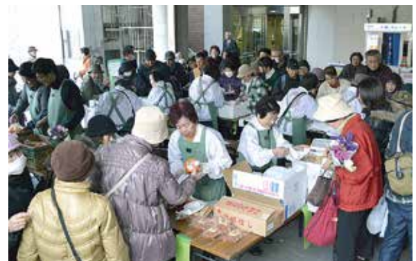
和歌山県すさみ町特産物即売会の様子

2月22日(金) 午前9時40分 雨天決行、市役所本館北側出入口ピロティ及び市総合センター1階ロビー、さんま寿司・芋餅・干物(あじ)、さんま、かますなど)・梅干しなど(無くなり次第終了)を販売。 閏 市・すさみ町都市提携連絡協議会事務局(市民活動振興室内) 825・2120)