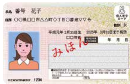
マイナンバー（個人番号）カード

○市の住民基本台帳に記録されている15歳以上の人で利用者証明用電子証明書を格納したマイナンバーカードを持っている人 ※市の住民基本台帳に記録されていない人でも市に本籍があり、戸籍証明書交付の利用者登録申請をしている人は、戸籍証明書が取得できます。 ☎ 市民課（☎824・1570）