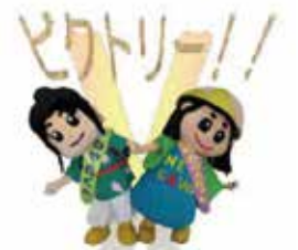
圖 子育てリフレッシュ館 (☎800・3862)

現在大好評の市のマスコットキャラクター「はちかづきちゃん」と「ねや丸くん」のLINEスタンプのアニメーション版が登場しました。かわいらしい表情で動き出す、はちかづきちゃんとねや丸くんはLINEスタンプショップで「はちかづきちゃん」又は「ねや丸くん」と検索すると確認できます。