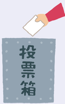
図 選挙管理委員会事務局(☎825・2435)

▽投票日時 4月21日(日) 午前7時～午後8時 ※投票日時は、寝屋川市市議会議員選挙及び寝屋川市長選挙と同じです。 ▽期日前投票期間・投票時間 4月10日～20日午前8時30分～午後8時 皆さん必ず投票に行きましよう。