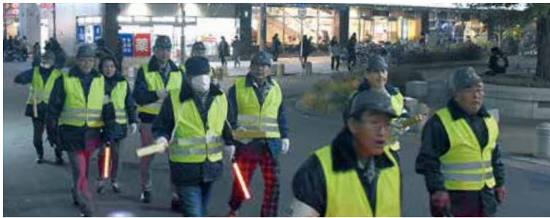
歳末防犯パトロール

域の人から「防犯のおっちゃん」と声を掛けられることがあります。顔見知りの人が守ってくれているという安心感があるのでしょうか。今後は夜間だけではなく、昼の活動を通して地域の協会員を身近に感じてもらうことも大切なことだと思っています。