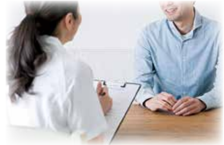
図 保健所準備室 (☎824・2112)

新たに移譲される保健所業務の事務権限と、現在市で行っている施策との相乗効果で、市民の皆さんの命と健康を守る施策展開を進めていきます。