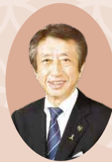
— 寝屋川市長 —