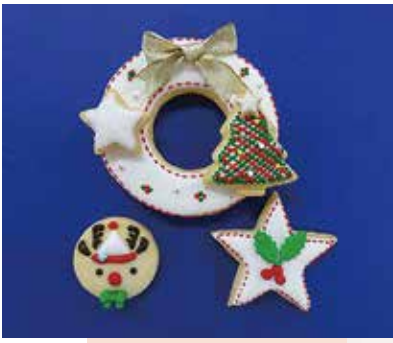
アイシングクッキー