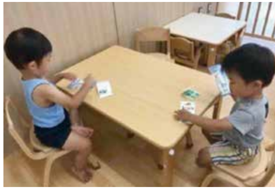
リラット一時預かり