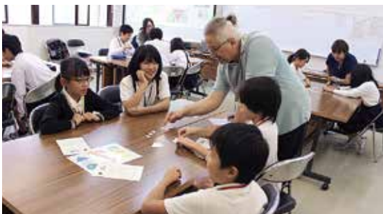
図形を使って楽しく英語を学んでいる様子

グローバル化が加速していく中で、小学生はもちろん、市でも多くの方が外国語や異文化に触れる機会があればいいなと思いました。