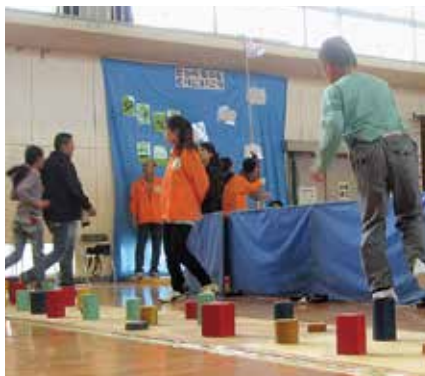
エンジョイスポーツ Day