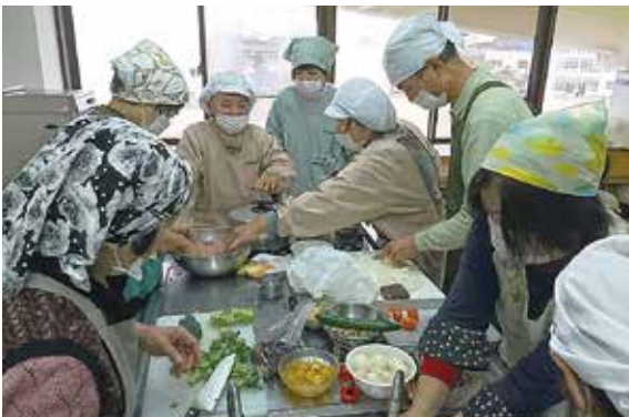
ふるさと料理講習会

時、市立エスポアール2階料理室、炊きおこわ・雑煮・牛肉の八幡巻き・はんぺん入り伊達巻き・ゆず茶の五色なます・紅白寒天ゼリー、市民24人(申し込みが多いときは抽選)、参加費1000円(材料代・資料代)。 申込 往復はがきに、住所、氏名、年齢、電話番号(返信用はがきにも住所、氏名)を書いて、11月10日(土)消印有効||までに市生活改善クラブ連合会(〒572-8555本町1番1号産業振興室内) 問 産業振興室(☎825・2673) 囲碁・将棋親子教室(後期) 囲碁:12月1日・8日・15日・平成31年1月5日・12日、いずれも土曜日、将棋:12月2日・9日・16日・1月6日・13日、いずれも日曜日 午前9時30分〜11時30分(計5回)、市立市民会館①親子初心者講座:4階研修室②修了者講座:第11会議室、市内在住・在学の小・中学生と保護者各回20組(申込順)、参加無料。 申込・問 11月5日(月)から電話で寝屋川囲碁将棋連盟(☎800・6802)月〜金曜日午後1時〜8時) 文化講座 △節約時短フッキング2V 11月22日(木)午前10時〜正午、市立学び館、定員12人(申込順)、材料費1000円、エプロン・三角巾・手拭きタオルが必要。 申込・問 11月9日・16日に直接窓口又は電話で市立学び館(☎822・