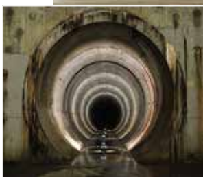
◀ 大阪北部地下河川讃良立坑

緊急地震速報訓練及び全国一斉情報伝達試験を実施 消防庁及び気象庁による全国一斉情報伝達訓練として、全国瞬時警報システム(アラート)を使った自動放送訓練を行います。 市内52か所に設置している屋外拡声スピーカーから放送します。 ▽日時 ①緊急地震速報訓練：11月1日(木) 午前10時頃②全国一斉情報伝達試験：21日(水) 午前11時頃