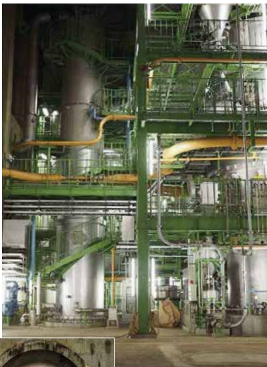
▶ 鴻池水みらいセンター

▽場所 リラット3階ミーティングルーム ※相談は無料、完全個室、子ども連れ可、キッズスペースがあります。 申込・開催日の前々日まで直接窓口又は電話で市立産業振興センター(☎828・0751) 香里園バル チケット1枚で1ドリンクと各店自慢の1皿が楽しめるイベントを香里園駅周辺の41店舗で行います。 ▽開催日 11月10日(土) △前売券販売▽ ▽期間 11月9日(金)まで ▽価格 5枚綴りチケット3000円(当日3500円) ▽購入方法 ①「香里園バル」ホームページ②バル参加店、チケット販売協力店 ※①当日券は午前11時〜午後8時に香里園駅西側ロータリーで販売します②詳しくは「香里園バル」ホームページを見てください。 ☎ 香里園バル実行委員会(☎831・0589)又は市産業振興室(☎828・0751)