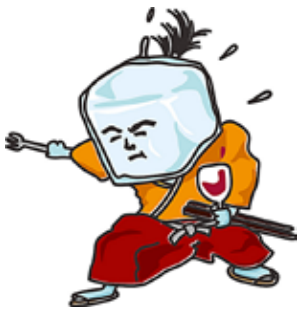
香里園バル キャラクター 「こうりえもん」

▽場所 リラット3階ミーティングルーム ※相談は無料、完全個室、子ども連れ可、キッズスペースがあります。 申込・開催日の前々日まで直接窓口又は電話で市立産業振興センター(☎828・0751) 香里園バル チケット1枚で1ドリンクと各店自慢の1皿が楽しめるイベントを香里園駅周辺の41店舗で行います。 ▽開催日 11月10日(土) △前売券販売▽ ▽期間 11月9日(金)まで ▽価格 5枚綴りチケット3000円(当日3500円) ▽購入方法 ①「香里園バル」ホームページ②バル参加店、チケット販売協力店 ※①当日券は午前11時〜午後8時に香里園駅西側ロータリーで販売します②詳しくは「香里園バル」ホームページを見てください。 ☎ 香里園バル実行委員会(☎831・0589)又は市産業振興室(☎828・0751)