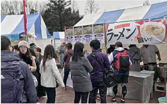
寝屋川ハーフマラソン うまいもんマルシェ (前回の様子)

を除く) ※物件の内容、入札参加者資格など、詳しくは市ホームページ「道路建設課」を見てください。 ④ 道路建設課 (☎82552290) 寝屋川ハーフマラソン2019 うまいもんマルシェ出店者募集 寝屋川ハーフマラソンの飲食ブースへの出店を募集します。 ▼日時 平成31年2月24日(日) 午前8時～午後2時(予定) ※マラソンは午前9時スタート。 ▼場所 寝屋川公園内 ▼対象 市内で店舗を営み、寝屋川保健所から営業許可及び市での露店営業許可を受けている飲食店13店舗(一店舗につき1ブース・申し込みが多いときは抽選) ▼内容 飲食物の販売