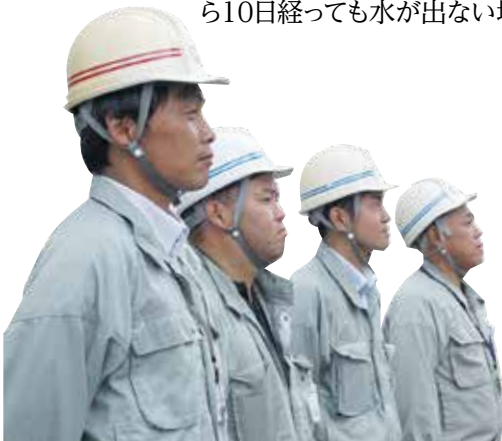
被災地への派遣職員

飲料水、洗濯などに使用する生活用水を求めて、大きなポリタンクやバケツ、ペットボトルなど、あらゆるものを持って家と給水所を何往復もする姿が多く見られました。「水が無いとトイレも流せない」「風呂に何日も入ってない」との声も。日常生活に水がないとどれほど困るか考えさせられました。