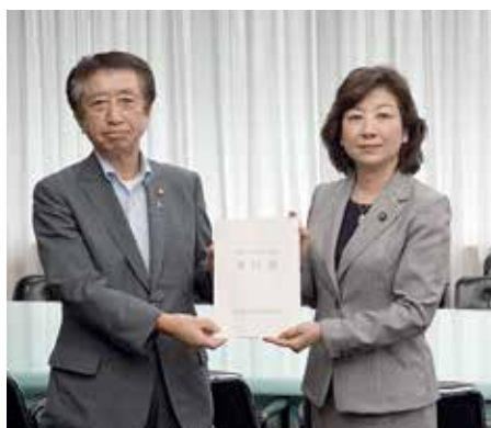
北川市長(左)と野田総務大臣(右)