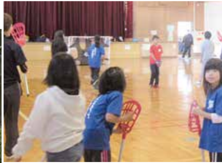
池の里クラブ後期スポーツ教室