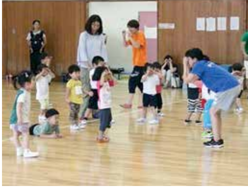
後期スポーツ教室