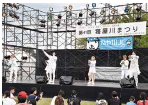
小ステージの様子

また、打上川治水緑地の真ん中には大きな芝生があり、ブルーシートを敷いてくつろぐ家族連れがたくさんいました。取材を通して寝屋川まつりにどんな思いが込められているのかわかってくれました。来年は、レポーターではなく、一般参加者として、寝屋川まつりを楽しみたいと思います。