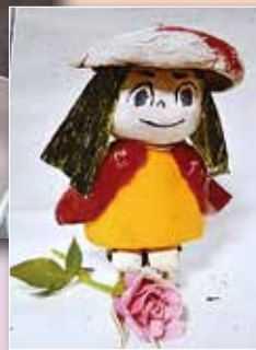
マッシュルームとしいたけなどで作った 鉢かづき姫

「クラウン(道化師)」 11月1日・15日・29日・12月6日 (計4回)、いずれも木曜日午後7時 ～9時、アルカスホール、「出来な いこと」が魅力に変わる講座、定員 15人(申込順)、参加費4800円(初 回一括払い)。 ※詳しくは「アルカスホール」ホーム ページ又はチラシを見てください。 申込・固 9月10日(月)から直接 窓口又は電話でアルカスホール(☎ 821・1240)