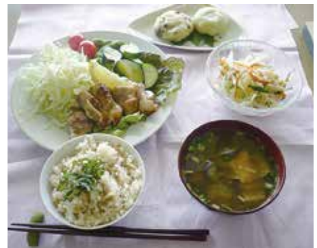
ふるさと料理講習会(前回の調理例)

申込・固 9月1日～30日までに参 加費を持って直接、市立中央公民館 (市立保健福祉センター5階☎83 8・0189) 10月22日(月)午前10時～午後1 時、市立エスポアール2階料理室、 昔ながらの巻き寿司・茶碗蒸し・ぶ りの照り焼き・さつま芋とりんごの ヨーグルトあえ・豆腐抹茶白玉、市 民24人(申し込みが多いときは抽