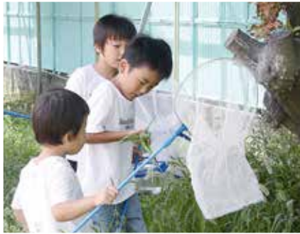
子ども自然シリーズ講座