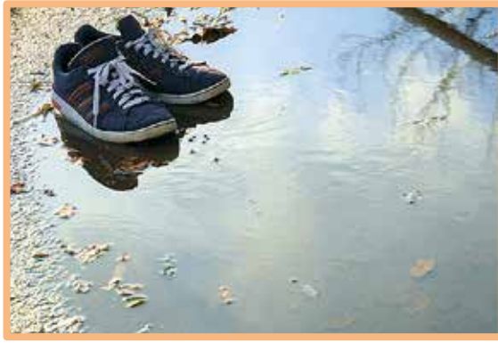
昨年度のグランプリ作品

▽テーマ 「わたしたちのくらしと水」 ▽対象 市内在住・在職・在学の人 ※中学生以下の応募はできません。 応募・図 応募用紙と市内で撮影した写真（A4サイズ、1作品につき