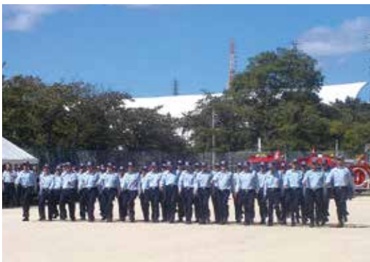
北河内地区支部総合訓練大会

9時から寝屋川公園で開催される「大阪府消防協会北河内地区支部総合訓練大会」に出場します。この大会では北河内7市の規律訓練、ポンプ操法模範訓練があり、本市を含む5市が行進間規律訓練を行います。見学も可能ですので、地域の安全を守る消防団の日頃の訓練の成果を見に来てください。