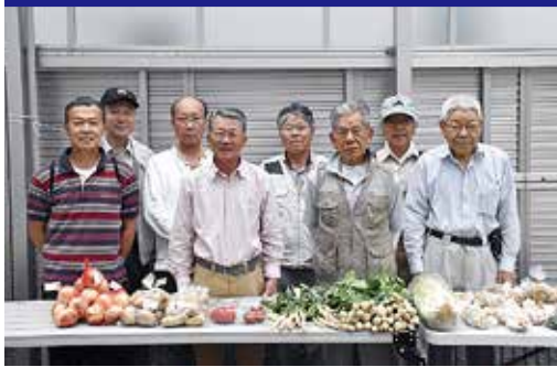
南ねや川農業研究クラブ