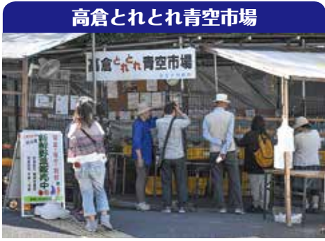
高倉とれとれ青空市場