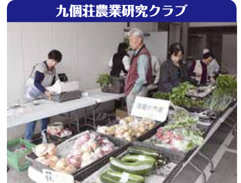
九個荘農業研究クラブ