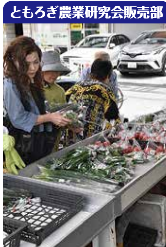
ともろぎ農業研究会販売部

店内にはとれたての野菜がズラリ。さらにスーパーなどで売られているものに比べて安いのも人気のポイントです。