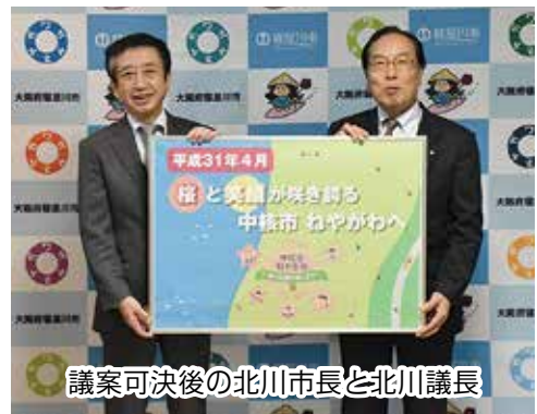
議案可決後の北川市長と北川議長