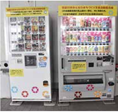
みんなのまちづくり支援自動販売機

売上金の一部が市のまちづくりに活用される「みんなのまちづくり支援自動販売機」Ⅱ写真Ⅱを市役所や市内公共施設に31台設置しています。売上金の一部を寄付金として基金に積み立て、現在から将来にわたる市民福祉の向上に寄与する施策・事業に活用します。