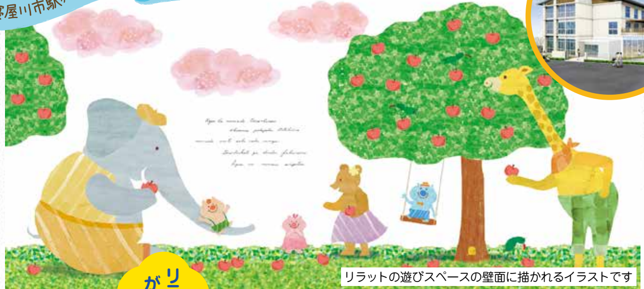
リラットの遊びスペースの壁面に描かれるイラストです