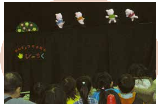
人形劇カーニバル

2月18日(土) 午前10時～午後3時、市立エスポール、内容などは下の表のとおり、参加費：高校生以上