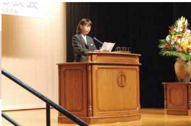
中学生による主張