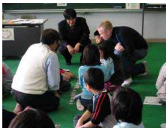
担任と英語担当教諭とALTのT.T.で英語活動