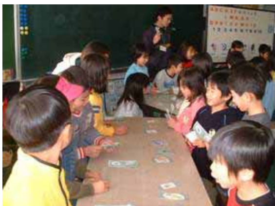
担任の先生中心に英語活動