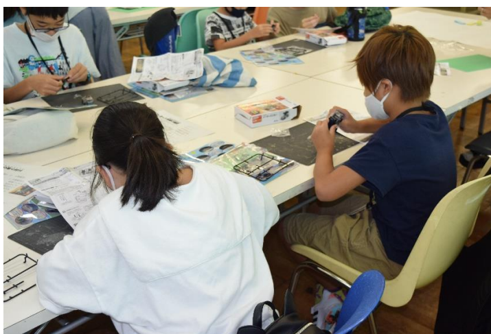
みんな真剣！工作中！