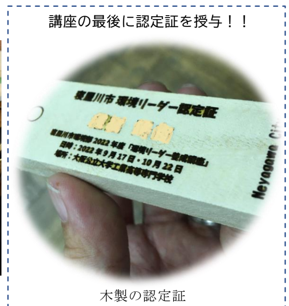
講座の最後に認定証を授与！！