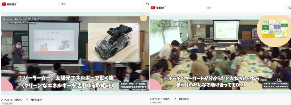
ソーラーカー工作