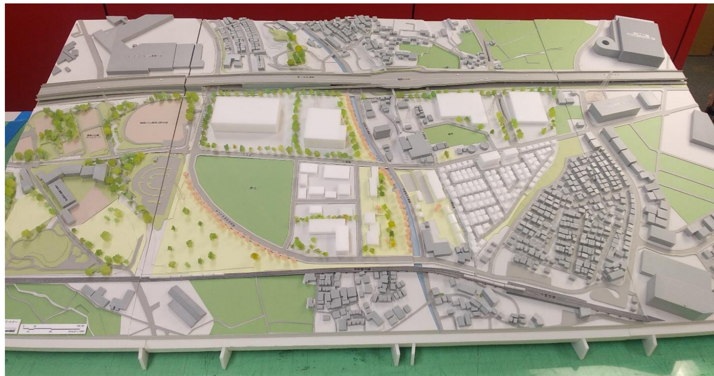
<提案内容を立体的に表現した模型>

お問い合わせ先：寝屋二丁目・寝屋川公園地区まちづくり協議会（寝屋川市2軸化事業本部） 担当：濱田・藤本 TEL：072-813-1204（直通）（平日9時～17時） <ご不明な点やご意見・ご相談等ございましたら、お気軽にお問い合わせ下さい。>