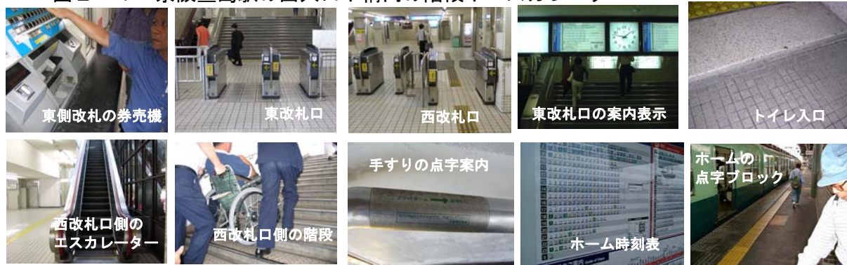
図2-1 京阪萱島駅の出入口や構内の階段やエスカレーター