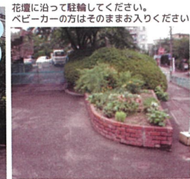
花壇に沿って駐輪してください。 ベビーカーの方はそのままお入りください