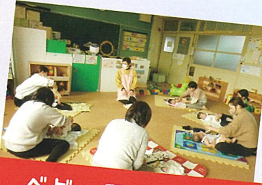
ベビーマッサージ