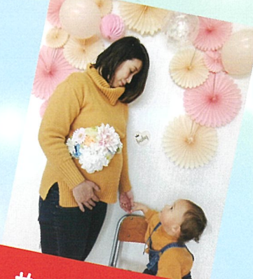
サッシュュベルト