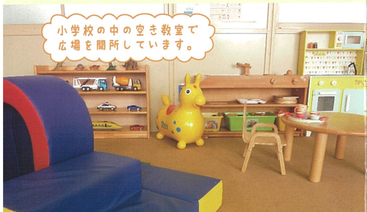
小学校の中の空き教室で 広場を開設しています。