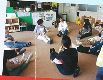
わらべうた親子体操