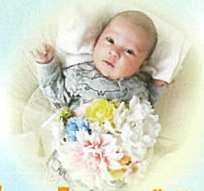
サッシュュベルト