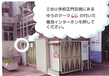
三井小学校正門右側にある ゆうのマークの付いた 専用インターホンを押して ください。

「香里園」寝屋川市駅から京阪バス「三井団地」バス停下車すぐ ※駐車場はありません。