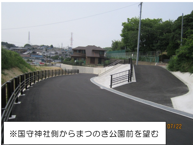
※国守神社側からまつのき公園前を望む