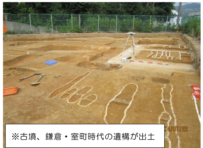
※古墳、鎌倉・室町時代の遺構が出土