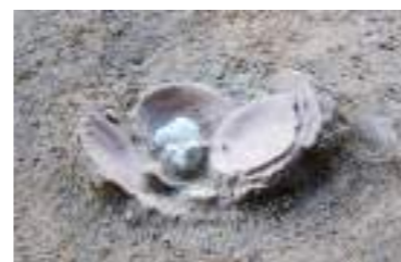
土器が数枚重なった状態で出土