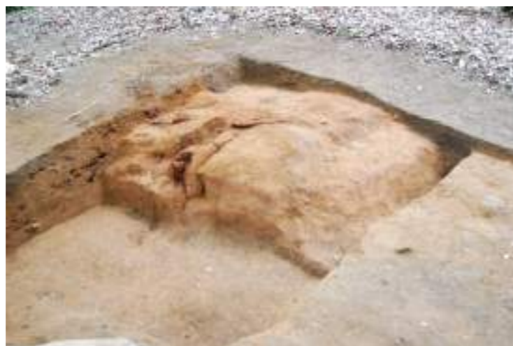
金堂基壇の南東隅(南東より)