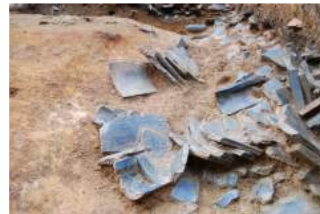
屋根から落ちた状態で見つかった瓦