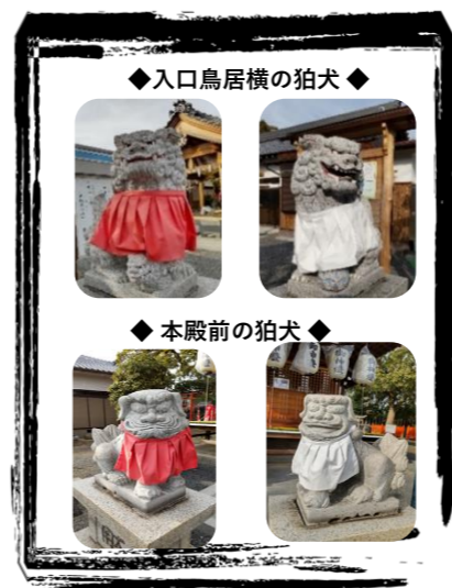
◆入口鳥居横の狛犬◆