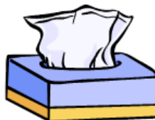
ティッシュの箱やお菓子の紙箱