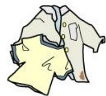
いらなくなった古着