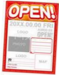
ポスティングチラシ