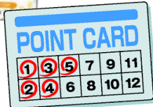
期限切れの ポイントカード