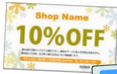
期限切れの クーポン券